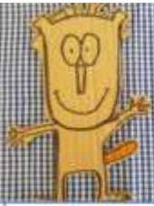
Tabela "A missão do Tristão"